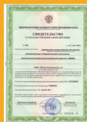
АККРЕДИТАЦИЯ № 2084 от 01.07.2016

МИФИ НАЦИОНАЛЬНЫЙ ИССЛЕДОВАТЕЛЬСКИЙ ЯДЕРНЫЙ УНИВЕРСИТЕТ