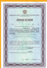
ЛИЦЕНЗИЯ №2151 от 24.05.2016