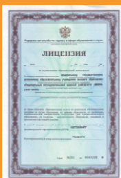
ЛИЦЕНЗИЯ №2151 от 24.05.2016