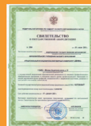
АККРЕДИТАЦИЯ № 2084 от 01.07.2016